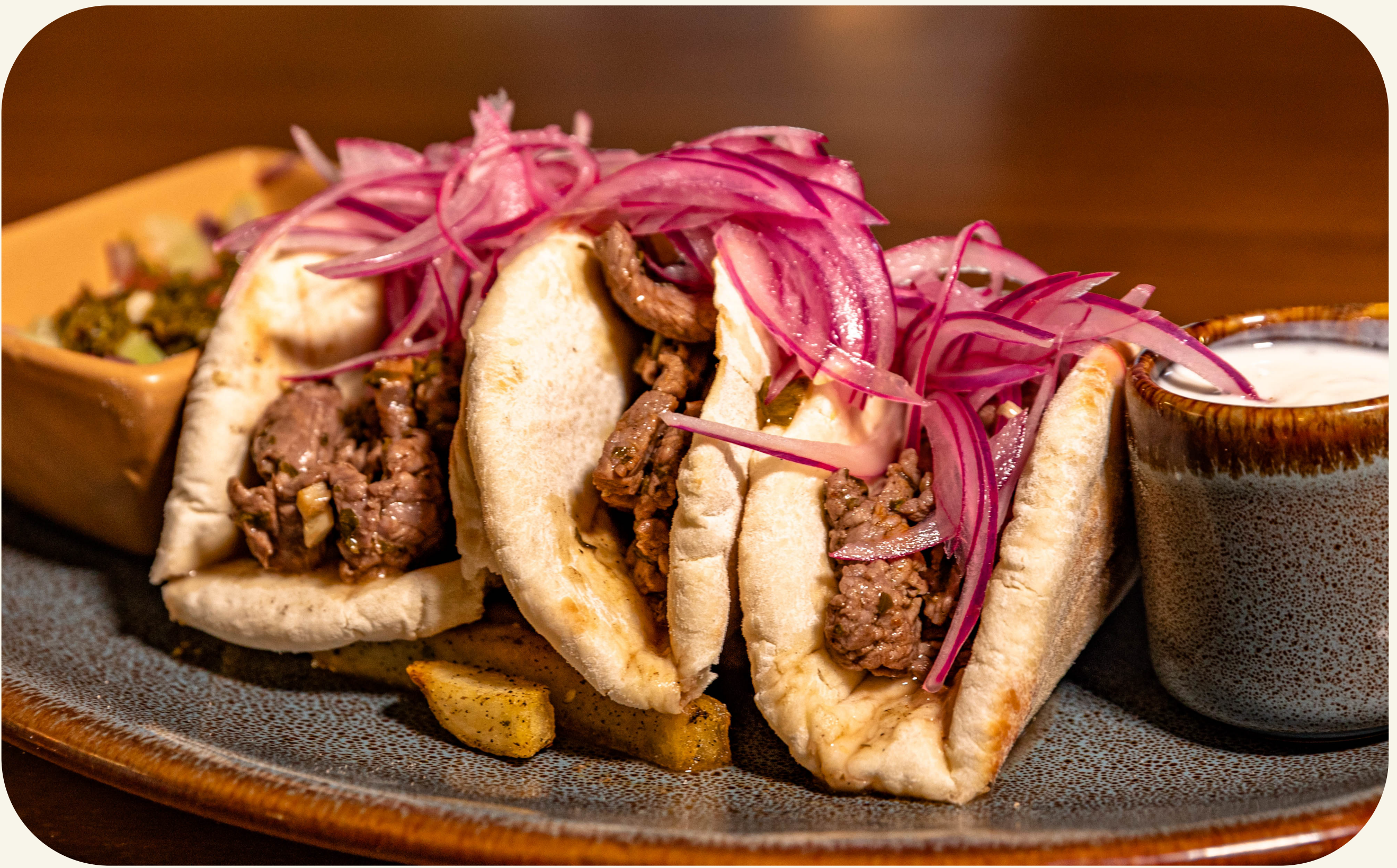
KEBABCITOS DE RES