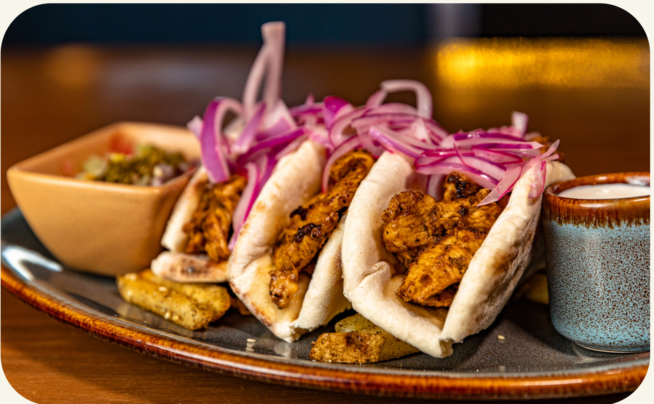
KEBABCITOS DE POLLO