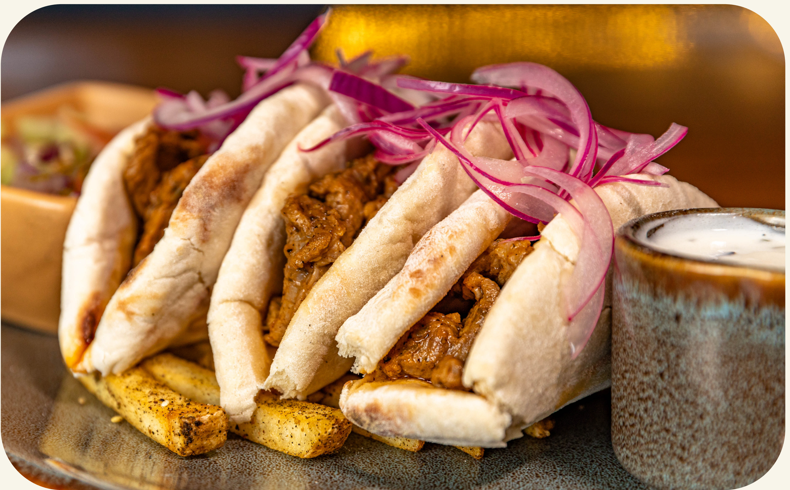
KEBABCITOS DE CORDERO